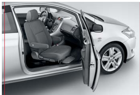
2. Fotel obraca się na zewnątrz, ponad progiem drzwi.