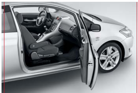
1. Fotel obraca się za pomocą ręcznej dźwigni.