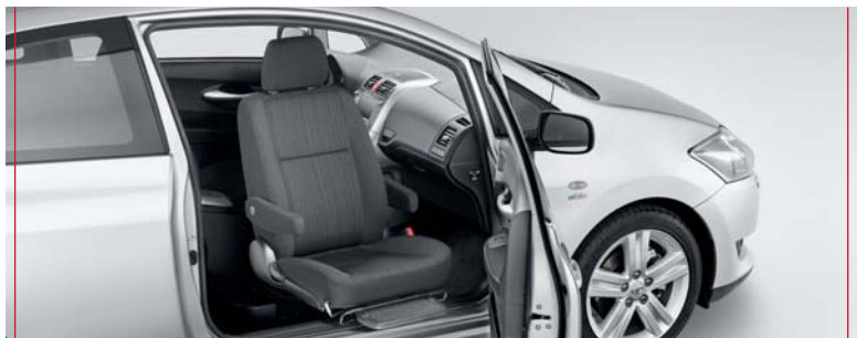
3. Wsiadanie i wysiadanie z samochodu jest łatwe i wygodne.